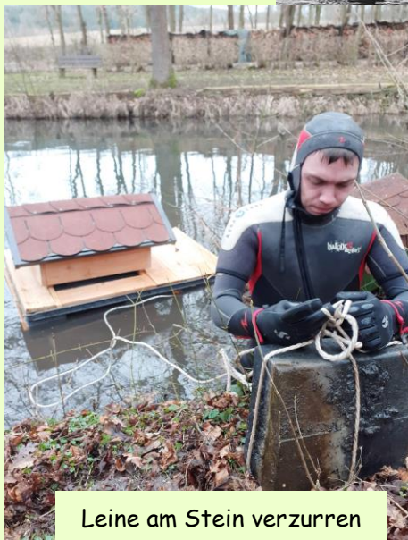
Leine am Stein verzurren