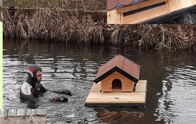
Position im Teich finden