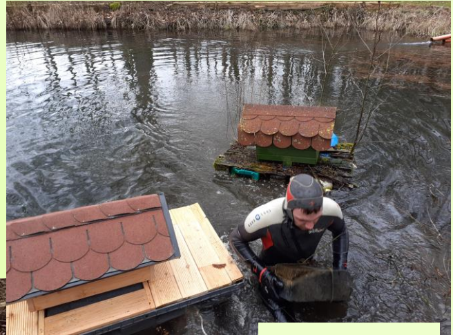
Alt und Neu nebeneinander